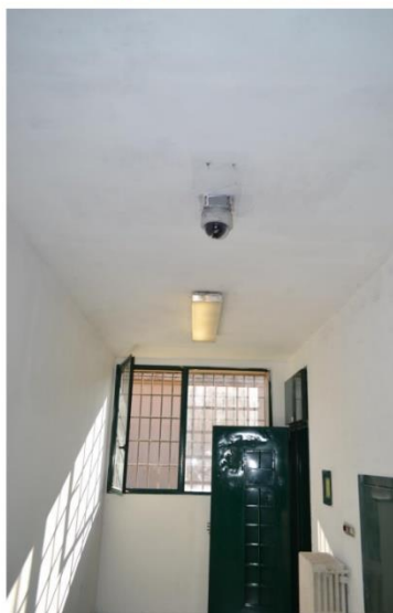
Telecamera n°69 isolamento lato A