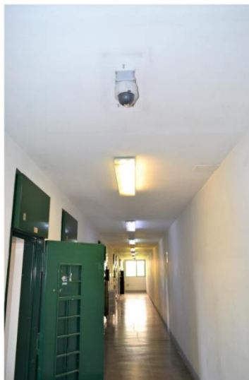
Telecamera n°71 isolamento lato B